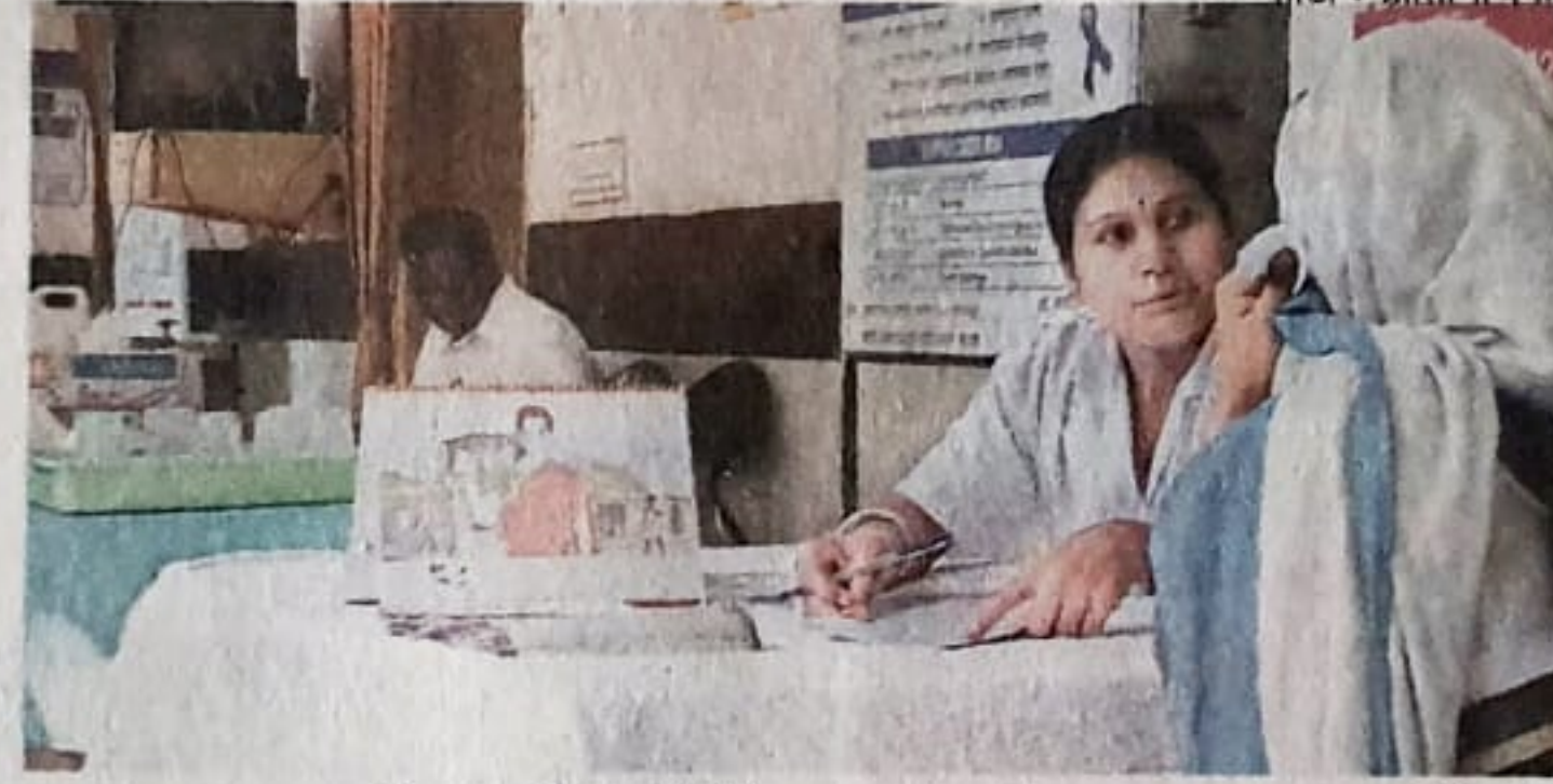
फोटो : प्रतिनिधिक

आरोग्य क्षेत्रात संशोधन, प्रशिक्षण, सेवा आणि प्रचार-पुरस्कार आदी क्षेत्रांमध्ये 'सेहत'चे काम चालते. ज्या समाजघटकांना संधी मोठ्या प्रमाणात उपलब्ध होत नाहीत, त्यांच्यासाठी प्रामुख्याने 'सेहत'च्या माध्यमातून मदत करण्यात येते. हिंसा आणि आरोग्य, लिंग आणि आरोग्य, आरोग्य क्षेत्रावर नियंत्रण, आरोग्य सेवा आणि वित्तपुरवठा या चार विभागांमध्ये 'सेहत' कार्यरत आहे. संस्थेच्या माध्यमातून प्रामुख्याने झालेले काम म्हणजे, गर्भारपणाच्या काळामध्ये रुग्णालयांमध्ये या महिलांशी संवेदनशीलपणे संवाद